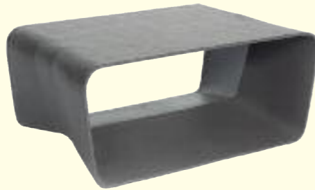
ECAL tisch/table 70 x 49 x 27 cm