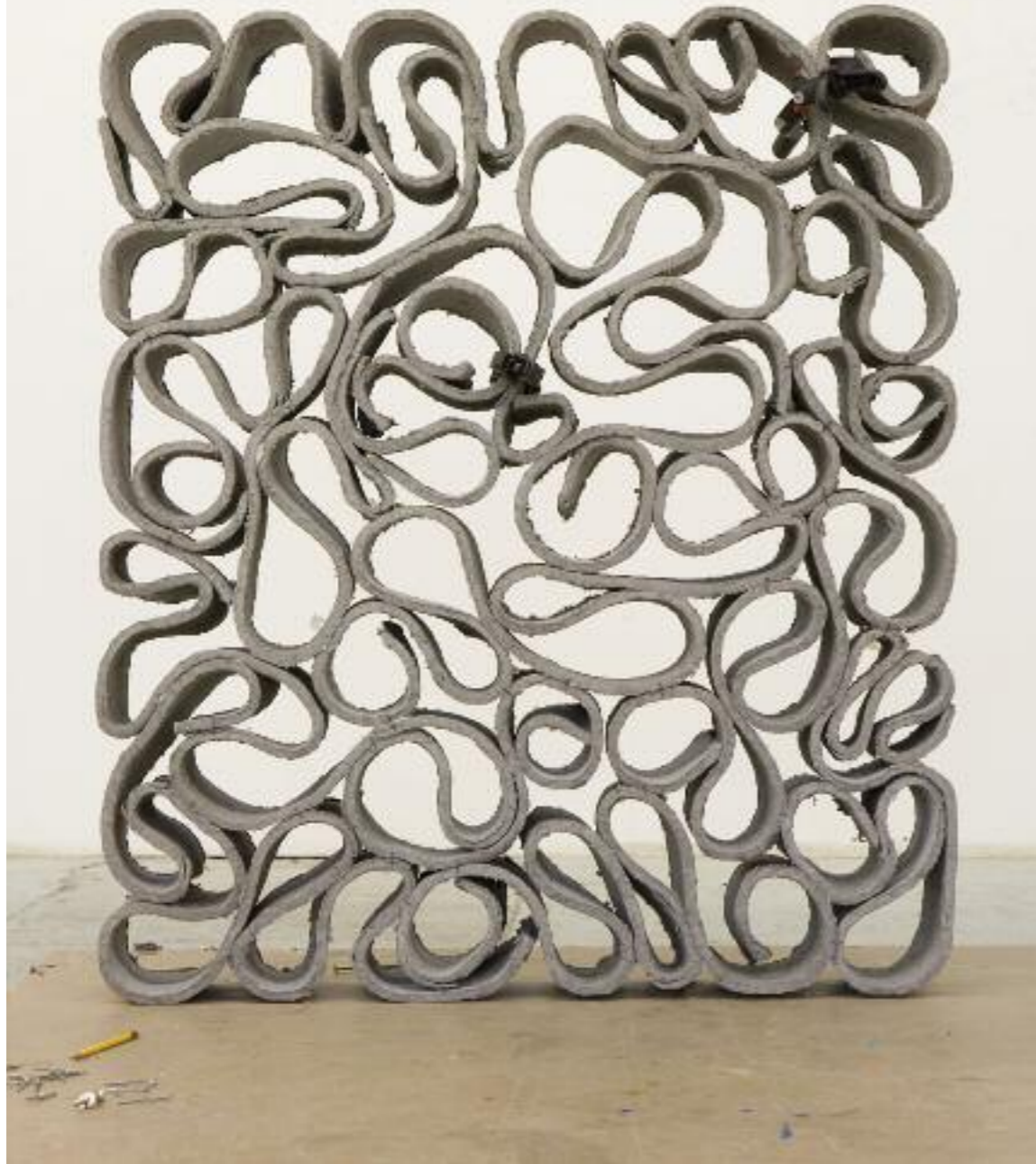
Sculpture by Beat Zoderer