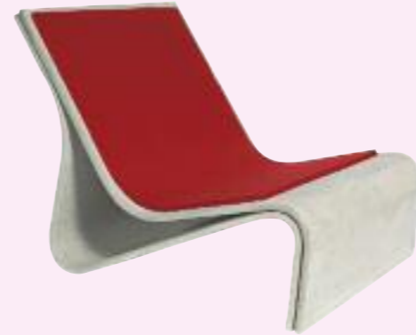
SPONECK stuhl/chair 77.5 x 50 x 60 cm