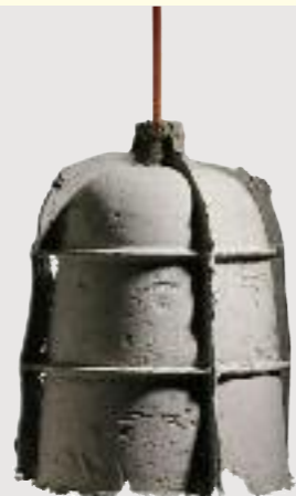
MOLD lampe/lamp Ø27 x 32 cm