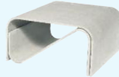
SPONECK tisch/table 50 x 50 x 25 cm