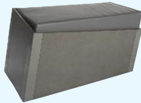
SHIFT hocker/stool 80 x 40 x 60/48 cm