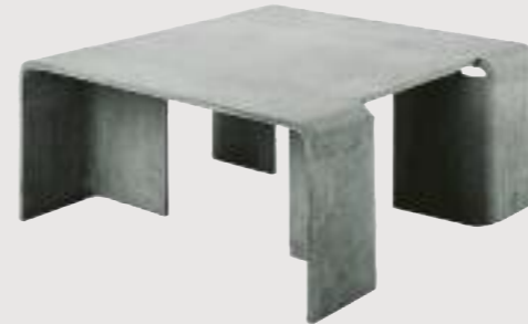
FOLD tisch/table 80 x 80 x 35 cm