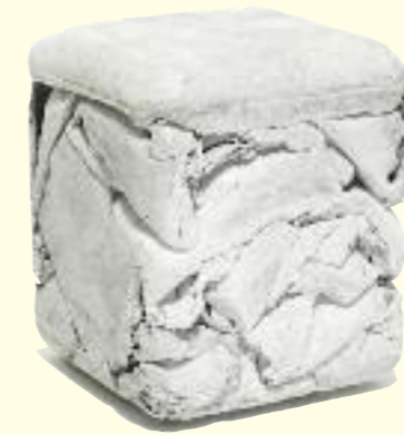
TRASH CUBE hocker/stool 31 x 31 x 36 cm

Faserzement inspiriert die Designer zur Gestaltung ganz unterschiedlicher Wohnaccessoires und natürlich von Pflanzgefäßen. Ob sie drinnen oder draussen zum Einsatz kommen, ist keine Frage des Materials, sondern des persönlichen Geschmacks.