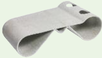
GUHL tisch/table 72 x 40 x 22 cm