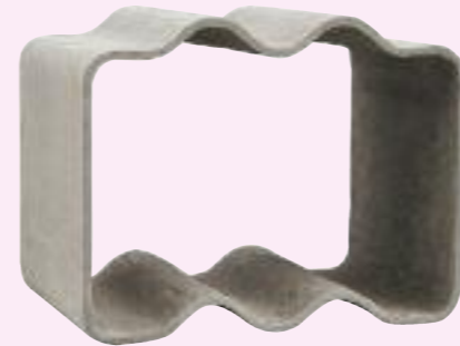
BLOX weingestell/wine rack 50 x 60 x 40 cm