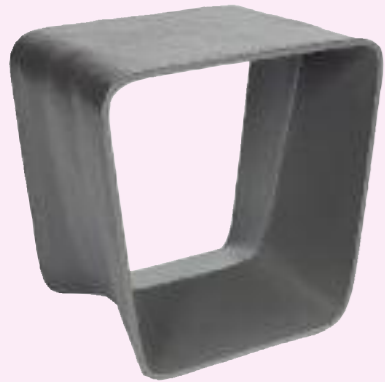
ECAL hocker/stool 42 x 32 x 42 cm