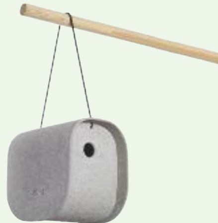
BIRDY nistkasten/nest box 21 x 16 x 22 cm