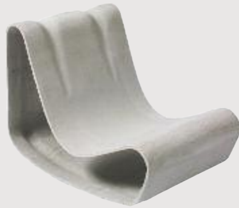
GUHL stuhl/chair 79 x 54 x 61 cm