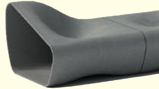
DUNE lounge system 79 x 54 x 61 cm