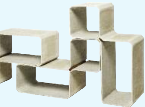
TETRIS regal/shelf 81 x 35 x 54 cm