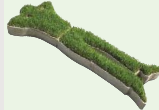
RELAX! 189 x 76 x 12 cm