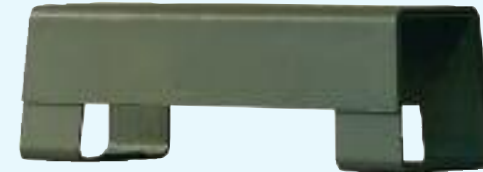
DIE BANK bank/bench 160 x 45 x 46 cm