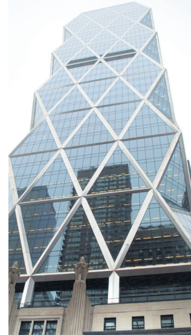
Der Hearst Tower (o.) des Architekturbüros Foster + Partners

Wärmedämmung für die gesamte Gebäudehülle