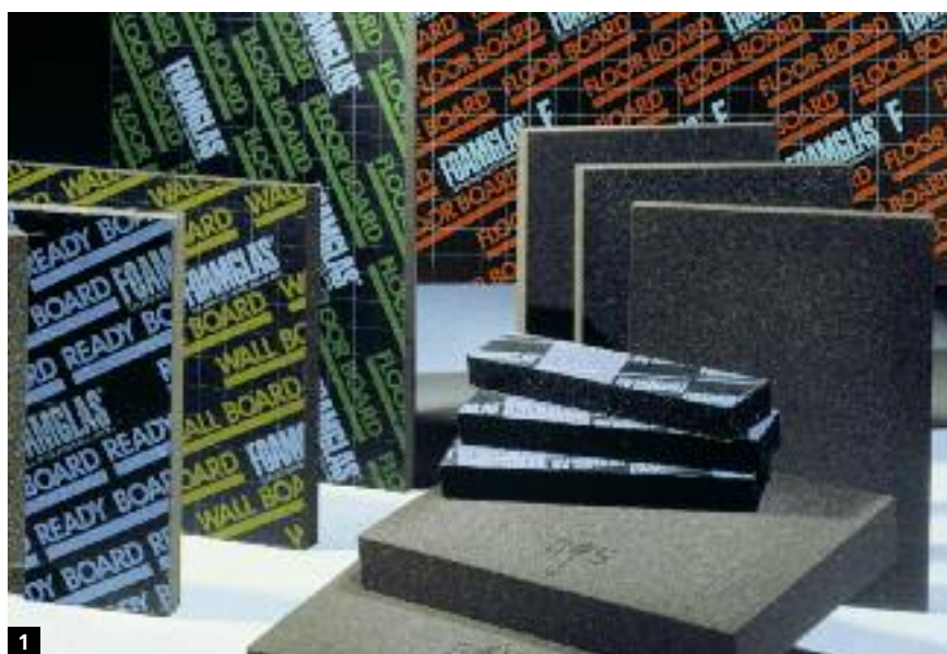
1 La gamma dei prodotti FOAMGLAS®

FOAMGLAS® è prodotto sotto forma di lastre e pannelli. Le tabelle seguenti vi informeranno sulle vaste possibilità d'impiego. Altro vantaggio dell'isolante FOAMGLAS®: le lastre e i pannelli sono facili all'impiego e messa in opera, questo favorisce un avanzamento rapido dei lavori e una maggiore redditività.